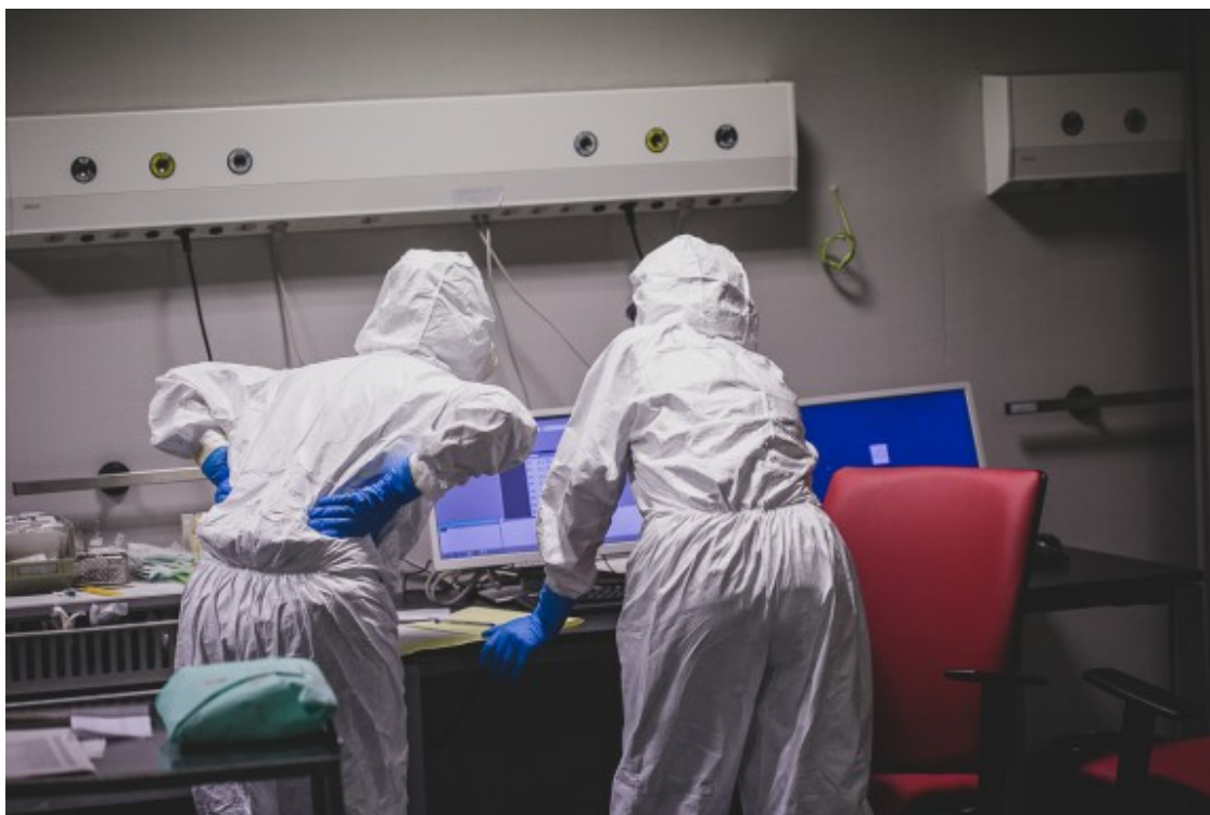
L'Hospital d'Olot per dins, en temps de Coronavirus.

Weber, Max (2017). La "objetividad" del conocimiento en la ciencia social y en la política social . Madrid: Alianza editorial.