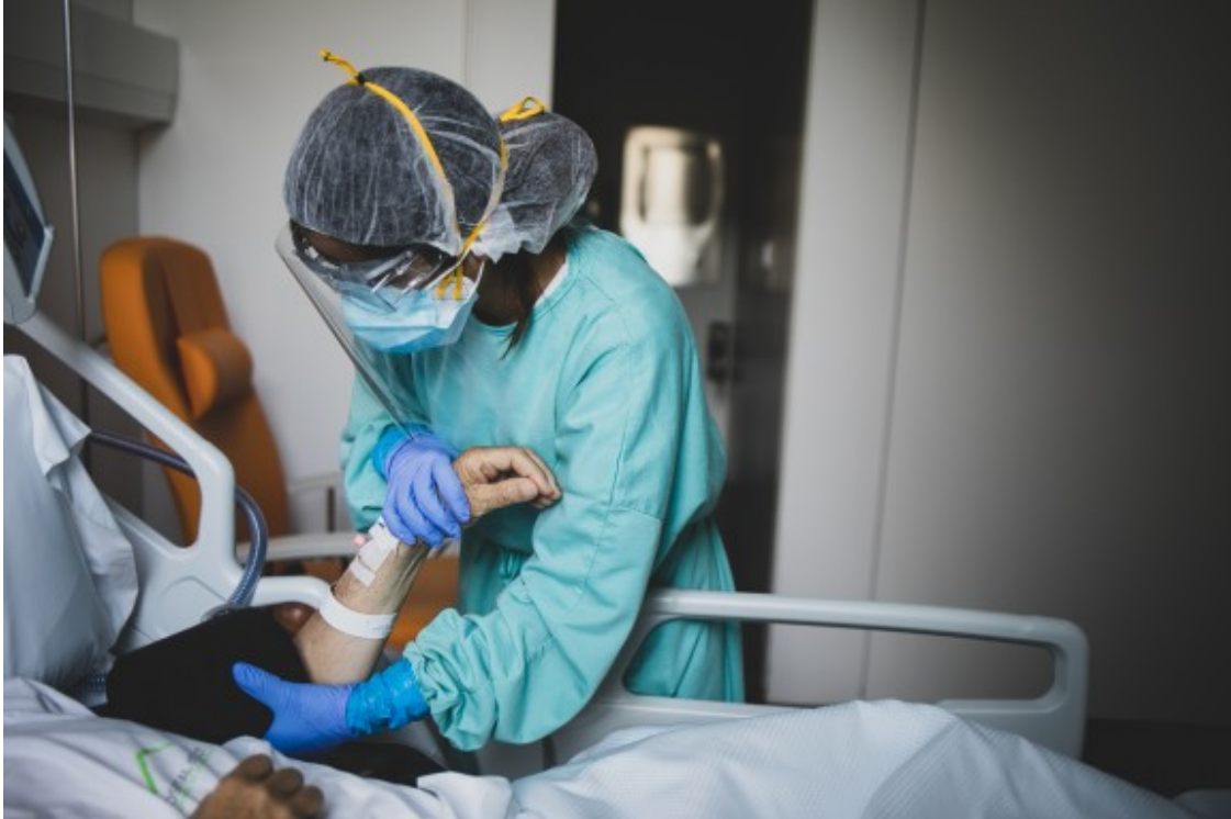
La pandèmia de la COVID-19 ens confirma que som fràgils.

mesures per aturar els efectes nocius de l'activitat humana envers el clima i l'estabilitat dels ecosistemes, la humanitat s'ha vist atacada per un fenomen natural que l'ha obligat a replegar-se com a espècie.