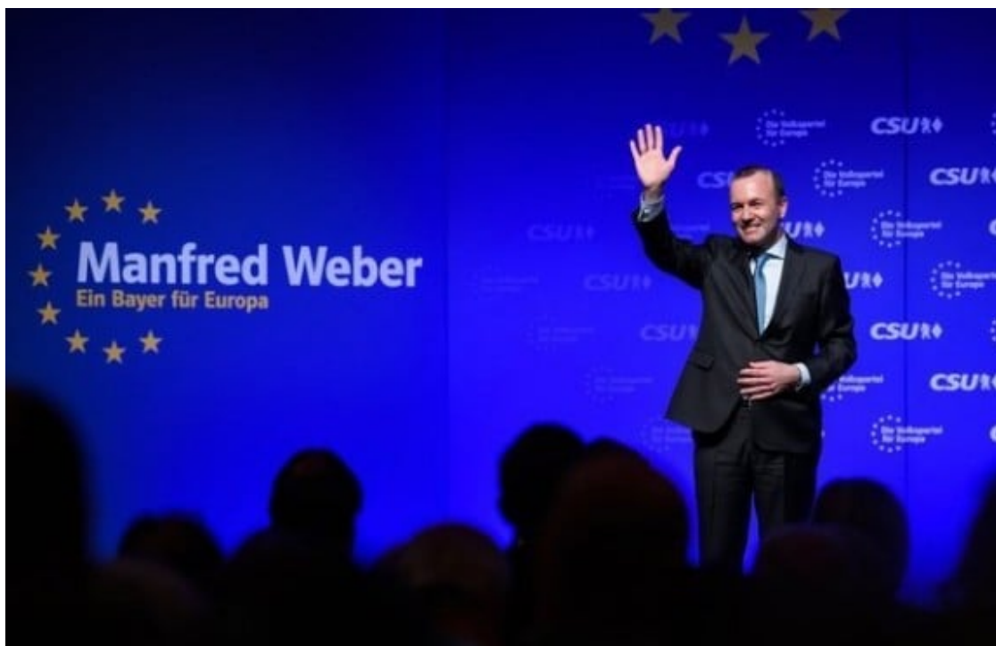
Manfred Weber, 'Ein Bayer für Europa'.

I tot el que sigui debilitar el govern de la Comissió Europea , com pretenen alguns presidents de govern, com pretenen els enemics d'aquest procés d'integració europea que ens ha donat el període més brillant de la història d'Europa, és limitar la capacitat dels europeus per ser l'actor global que el món necessita que Europa sigui.