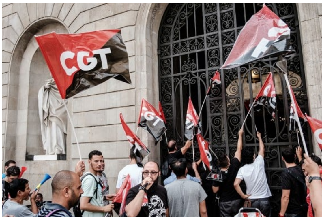
Protesta dels treballadors del Bicing davant l'Ajuntament de Barcelona Foto: Adrià Costa.

Serà, en definitiva, el mateix fenomen de la crisi el qual obrarà com a desllorigador de la situació en la que la democràcia per la seva pròpia naturalesa insurreccional, tal com és apuntat per Miguel Abensour, adquireix una forma latent d'obertura a la possibilitat, ja que no només consolida l'efecte produït, sinó que permet el canvi. Sent aquesta latència pròpia a la democràcia la que ens permet repensar la noció del que és col·lectiu en direcció a l'obtenció de resultats que ha d'arribar per la via de les individualitats en la seva acció concertada.