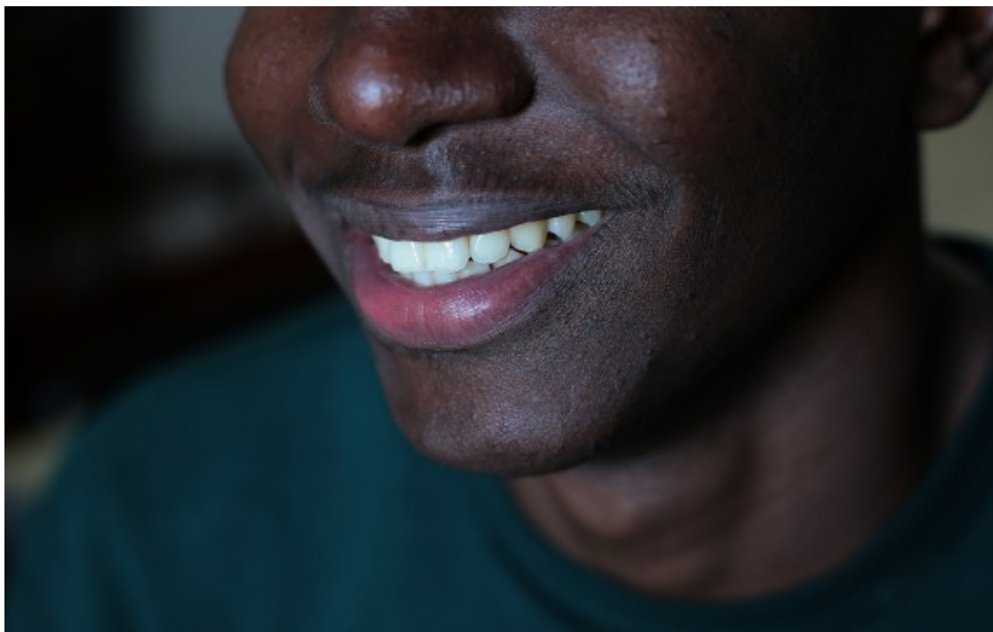
Un menor arribat a Catalunya i tutelat per la Generalitat.

L'atenció als MENA comporta posar en marxa un conjunt d'actors: l'Oficina d'Atenció al Menor dels Mossos d'Esquadra, l'Institut de Medicina Legal i Ciències Forenses de Catalunya, la Fiscalia Provincial de Menors, la DGAIA, i en el seu cas, els jutges que supervisen les decisions. D'una banda entra en joc la legislació d'Estrangeria, però de l'altra, la referent als drets dels infants, i en especial el concepte d'interès superior del menor, que protegeix l'exercici dels seus drets , i els garanteix que les proves que se li practiquin no vulnerin la dignitat humana, en aspectes com el consentiment informat davant les proves per determinar l'edat, que aquestes no siguin invasives i no vagin més enllà dels aspectes imprescindibles, la designació d'un representant legal, el benefici del dubte, la tramitació de la protecció internacional, o la impugnació del procediment per a determinar l'edat.