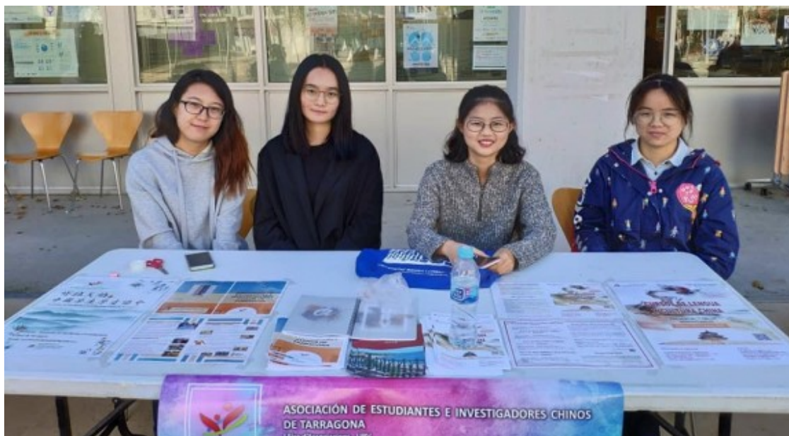
Paradeta de l'Asociación de Estudiantes e Investigadores Chinos de Tarragona, a la URV.

Els que tenien interaccions passives solen optar per no parlar català a causa de la manca de confiança en les seves habilitats d'expressió oral. Però escoltaven amb atenció mentre els PNs estan parlant. Ho van prendre com un input de la llengua objectiva i, de tant en tant, van aprendre alguna cosa.