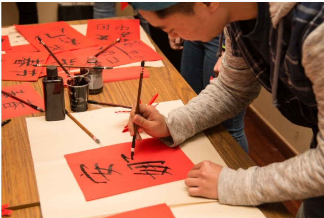
Activitats de celebració de l'any nou xinès a la UdL, el 2018.