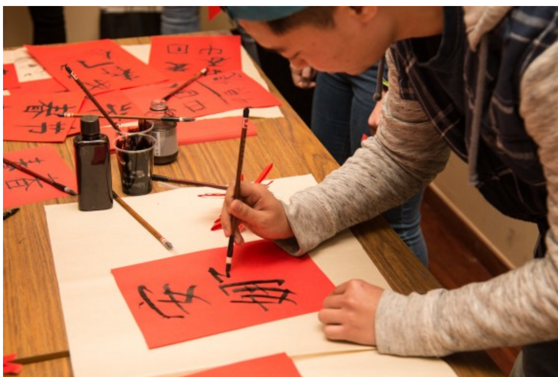
Activitats de celebració de l'any nou xinès a la UdL, el 2018.

Quant a la tercera pregunta, cap dels participants considerava les xarxes socials l'única o la més important forma d'aprendre català, però tots estaven d'acord que participar-hi és una bona manera d'interioritzar el vocabulari après a classe i millorar la fluïdesa de la parla. Tots eren plenament conscients dels possibles inconvenients d'estudiar una llengua en una societat bilingüe, que es podria disminuir el número de persones que parlin català perquè alguns PN prefereixen parlar castellà. D'altra banda, el bilingüisme significa que tenen més d'una opció, de manera que és probable que optin per parlar castellà en moltes situacions per evitar dificultats de comunicació, cosa que disminuiria encara més les oportunitats d'utilitzar català. Així, alguns participants, tot i que vivien a la comunitat de l'idioma objectiu, van percebre parlar català com a "una cosa que heu de demanar".