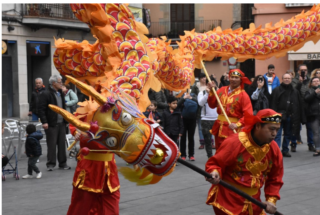
Festa de l'Any Nou Xinès a Manresa, el gener d'enguany. | Àlex Gómez Ribera.

Doctorands i estudiants de màster que estan inscrits a cursos de català es troben que els catalanoparlants tendeixen a canviar-los de llengua, a causa de la ideologia diglòssica tradicional