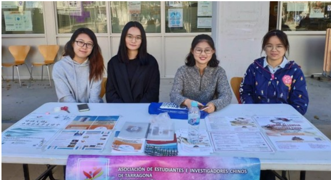
Paradeta de l'Asociación de Estudiantes e Investigadores Chinos de Tarragona, a la URV. Foto: Asociación de Estudiantes e Investigadores Chinos de Tarragona.

Els que tenien interaccions passives solen optar per no parlar català a causa de la manca de confiança en les seves habilitats d'expressió oral. Però escoltaven amb atenció mentre els PNs estan parlant. Ho van prendre com un input de la llengua objectiva i, de tant en tant, van aprendre alguna cosa.