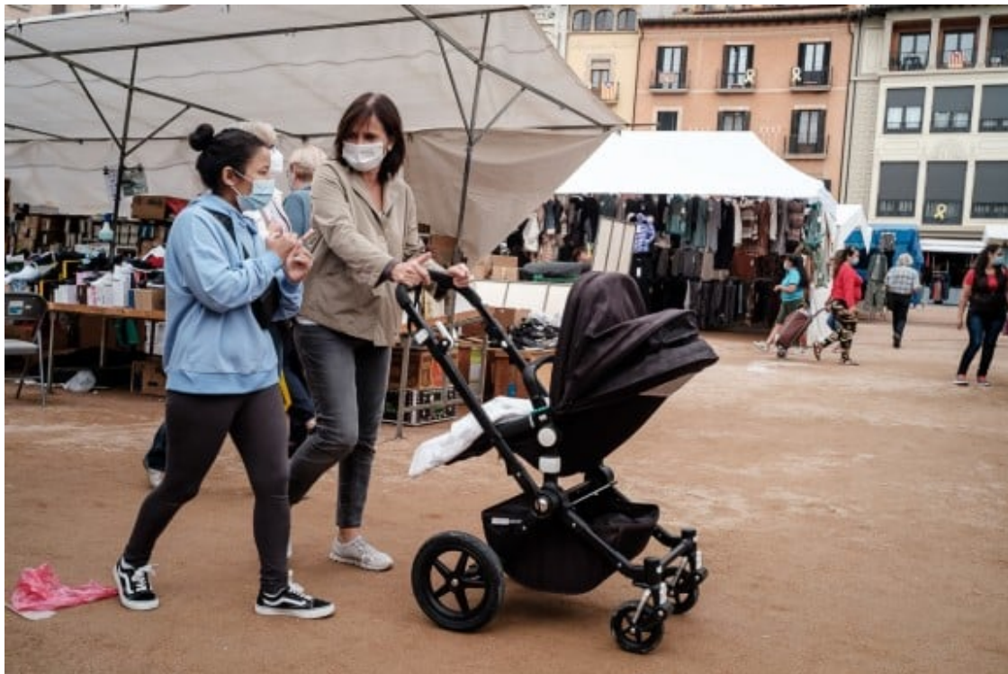
Les tasques domèstiques i de cura es consideren com a propis principalment de les dones.

Una de les novetats de les aportacions d'aquest llibre són els resultats de l'anàlisi qualitativa a càrrec de Marc Barbeta-Viñas, Tomás Cano i Dafne Muntanyola [capítols 4, 6 i 8]. La mostra feta servir en l'anàlisi prové de 5 grups de discussió fets a Barcelona i 5 a Madrid (8 conformats per pares i 2 per joves) entre el maig i el juliol del 2015. Malgrat els indubtables avenços realitzats, certificats per l'anàlisi de les enquestes de l'ús del temps, les conclusions extreïdes d'aquest conjunt d'estudis mostren els esculls en la reinstitucionalització de la figura paterna en curs, així com la presència de claroscurs en la implicació dels nous pares. Algunes de les evidències ambivalents obtingudes evoquen la persistència de la importància simbòlica i identitària del model del sustentador masculí de manera que el treball fora de la llar es considera encara com a propi dels homes en contrast amb les tasques domèstiques i de cura, a càrrec principalment de les dones.