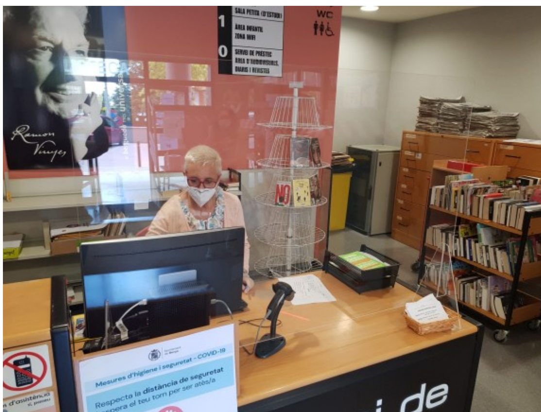
Les biblioteques i centres cívics han vist totalment alterada la seva funció social de garants d'accés a la cultura.

3) Integralitat. Es tracta d'aquelles intervencions que incorporen una mirada multidimensional del problema de la desigualtat en la participació en la vida cultural a la ciutat. Per exemple, reconeixent la dimensió educadora dels centres culturals, una estratègia clau per promoure l'equitat, encara més en temps de pandèmia. En aquest sentit, incorporar la perspectiva educativa en la política cultural no passa només perquè un equipament cultural treballi conjuntament amb un centre educatiu. Un equipament o organització cultural pot incorporar la mirada educativa (o la perspectiva de gènere, o el treball territorial comunitari, o la promoció de la salut comunitària, etc.) més enllà de les col·laboracions establertes amb els agents que formalment es dediquen a aquests temes.