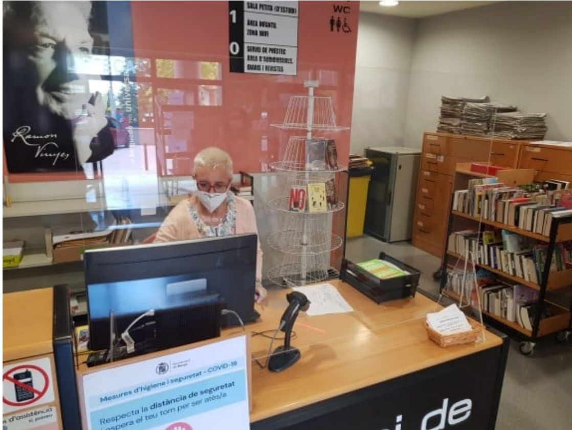
Les biblioteques i centres cívics han vist totalment alterada la seva funció social de garants d'accés a la cultura.

conjuntament amb un centre educatiu. Un equipament o organització cultural pot incorporar la mirada educativa (o la perspectiva de gènere, o el treball territorial comunitari, o la promoció de la salut comunitària, etc.) més enllà de les col·laboracions establertes amb els agents que formalment es dediquen a aquests temes.