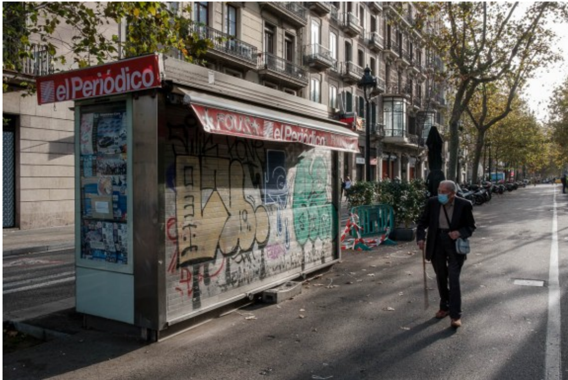
Un quiosc tancat, a Barcelona, aquest novembre.

Com han afectat o afecten les polítiques adoptades en l'àmbit en qüestió?