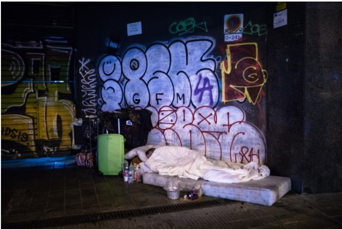
Una persona sense llar dormint al carrer.

L'hostilitat, la soledat i la malaltia incrementen la desesperació de viure el sensellarisme en qualsevol de les seves formes. Un dels indicadors més evidents és l'elevada prevalença de suïcidis ( https://www.redalyc.org/pdf/1806/180645927006.pdf ) (PDF) entre les PES, i com aquesta problemàtica passa àmpliament desapercibuda ( https://ps.psychiatryonline.org/doi/full/10.1176/ps.2006.57.4.447 ) fins i tot per investigadors sobre salut mental.