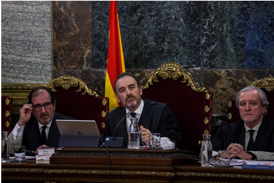
El magistrat Manuel Marchena, presidint la sala durant la primera jornada del judici de l'1-O.

Reproducció del capítol inicial del llibre, que relata com l'Estat ha encarat les demandes polítiques sorgides a Catalunya | «La manca de cultura democràtica ha alimentat una visió dicotòmica de la política pròpia d'un conflicte bèl·lic. Nosaltres o ells. Amic o enemic»