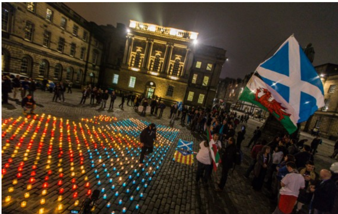
Estelada d'espelmes a Edimburg els dies previs al referèndum.