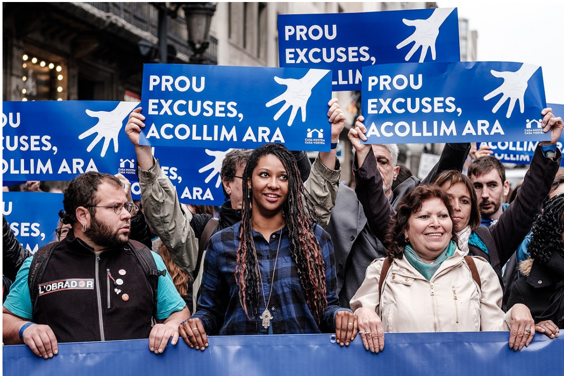
Manifestació «Volem acollir» a Barcelona, el 18 de febrer de 2017.

Entre el 1996 i el 2020, la població estrangera empadronada a Catalunya ha passat de 97.789 persones a 1.260.000 | La immigració es defineix com un fenomen consubstancial de la societat catalana