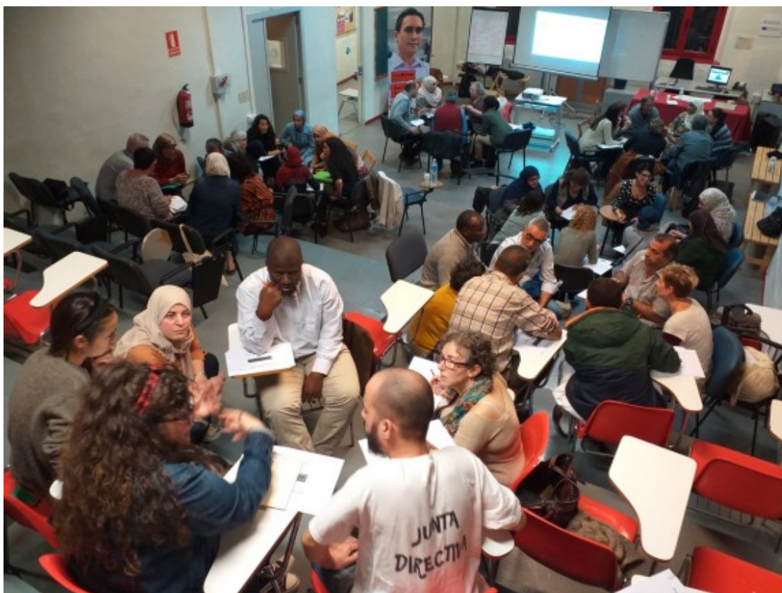
Procés participatiu sobre el Pacte Nacional per la Interculturalitat, que Afers Socials va promoure el 2019.

En aquest sentit, els documents polítics recullen dos missatges aparentment contradictoris . Per una banda, com ja s'ha dit, un discurs polític favorable a la immigració, que tendeix a inserir-les en una línia de continuïtat històrica i a crear un marc discursiu positiu amb voluntat de transcendir a la societat, basat en els drets humans i la igualtat. Per altra banda, la immigració és definida, d'una forma utilitarista, com una oportunitat i un recurs per satisfer algunes de les limitacions de la societat catalana. Per exemple: la immigració es considera necessària per fer front a les tradicionals baixes taxes de fertilitat; per compensar el desequilibri en la piràmide demogràfica, cada vegada més envellida i amb menys joves; o per cobrir els llocs de treball de baixa qualificació i remuneració que la població autòctona evita.