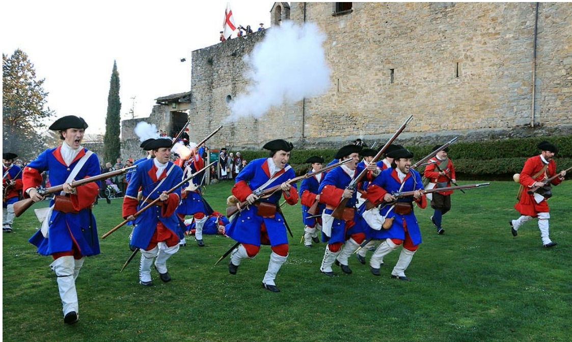
Recreació de la batalla de Montesquiú de 1714. | Josep M. Costa

Va ser una guerra internacional que va esdevenir definitivament civil, a Espanya, a partir de 1705, quan els representants de la Corona d'Aragó es van alinear amb els austriacistes