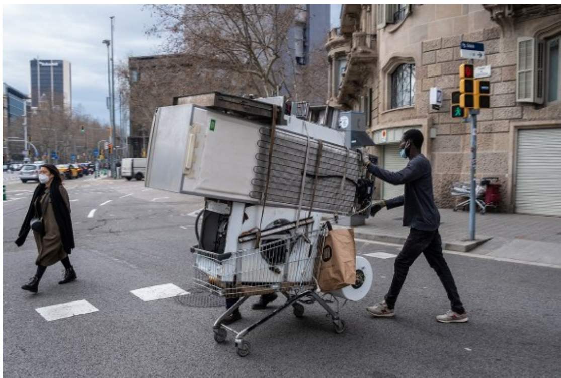
Un ferrellaire al centre de Barcelona.