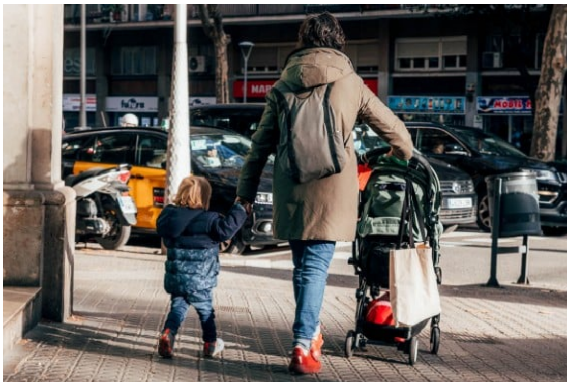
El 1975, l'edat de la primera maternitat era de 25 anys, mentre que el 2019 era de 31.

Per tant, quan arriba el moment de tenir fills/es, és massa tard perquè les dones es puguin reproduir biològicament , i es veuen obligades a recórrer a tècniques de reproducció assistida -amb gàmetes o embrions donats-, l'adopció o la gestació per substitució.