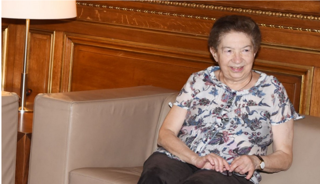
La historiadora Eva Serra, en una imatge del 2015.

Reproducció de la conferència pronunciada per Albert Botran amb motiu del lliurament a títol pòstum del XXXIV Premi Ferran Soldevila a la historiadora atorgat per la Fundació Congrés de Cultura Catalana el 12 de juny de 2019