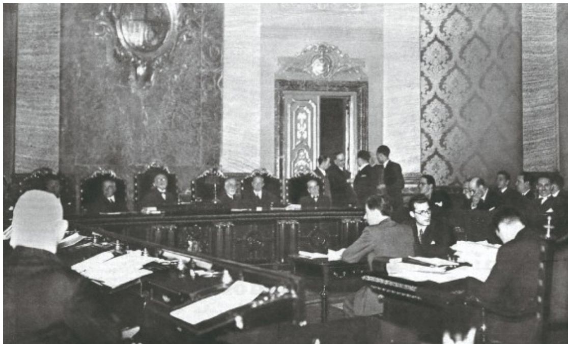
Judici a Lluís Companys al llavors Tribunal de Garanties Constitucionals, que el va condemnar a 30 anys de presó per insurrecció.

Lerroux) i s'alimentava de la dèria sistemàtica de bona part de la premsa de Madrid per etiquetar qualsevol moviment català com a "separatista", ja fos el tancament de caixes del 1899 o la revolta anticlerical i antimilitarista del 1909.