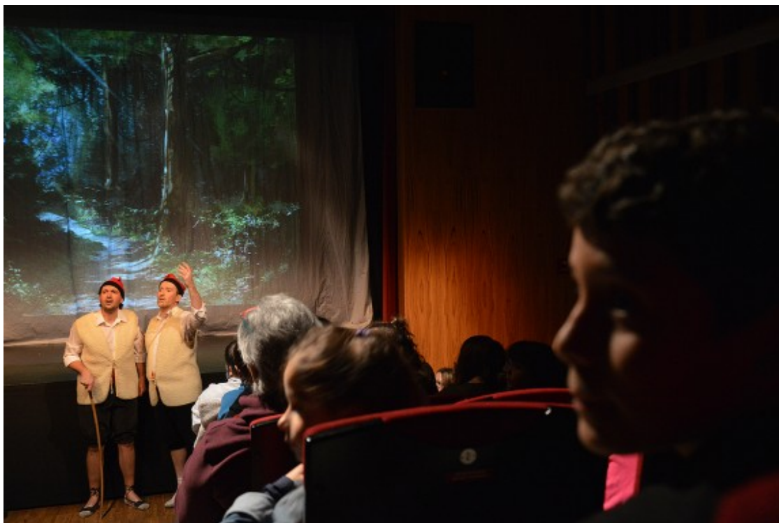
Es ateneus acullen múltiples formes de cultura, com aquesta representació dels Pastorets a l'Orfeo Martinenc.