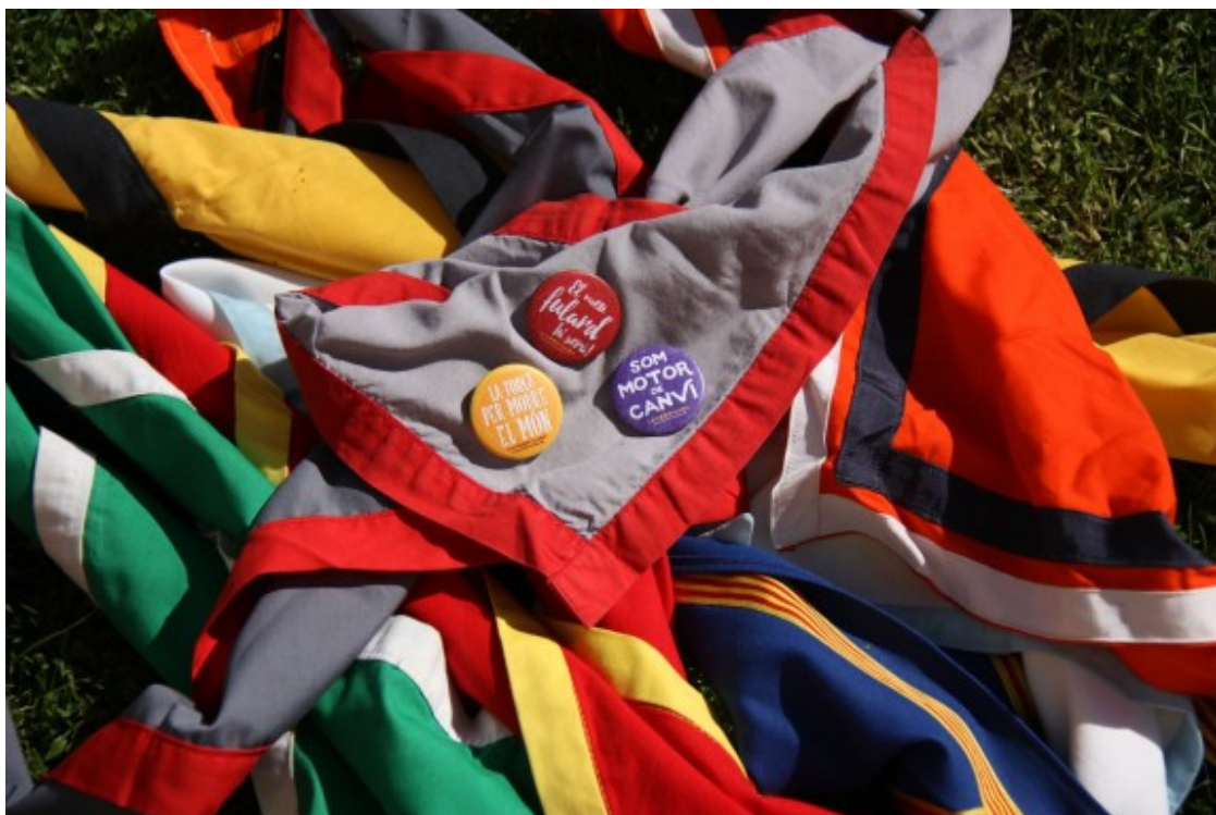
El moviment escolta compta amb una implementació notable arreu de Catalunya.