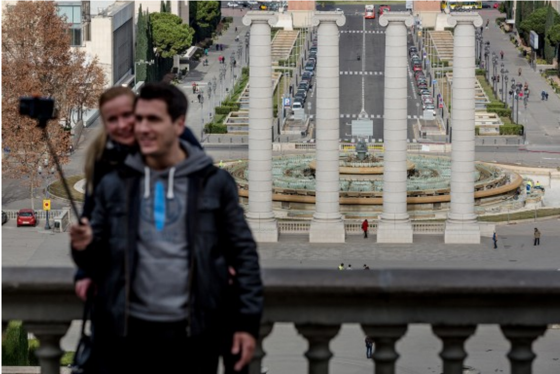
Les Quatre Columnes de Puig i Cadafalch, a Montjuïc