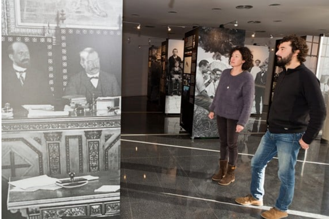
Exposició sobre el centenari de la Mancomunitat de Catalunya, el 2014.

provincials castellaneres i nombroses entitats econòmiques i culturals de la capital que aplegaria unes 100.000 persones en defensa de la unitat d'Espanya i contra l'Estatut català.