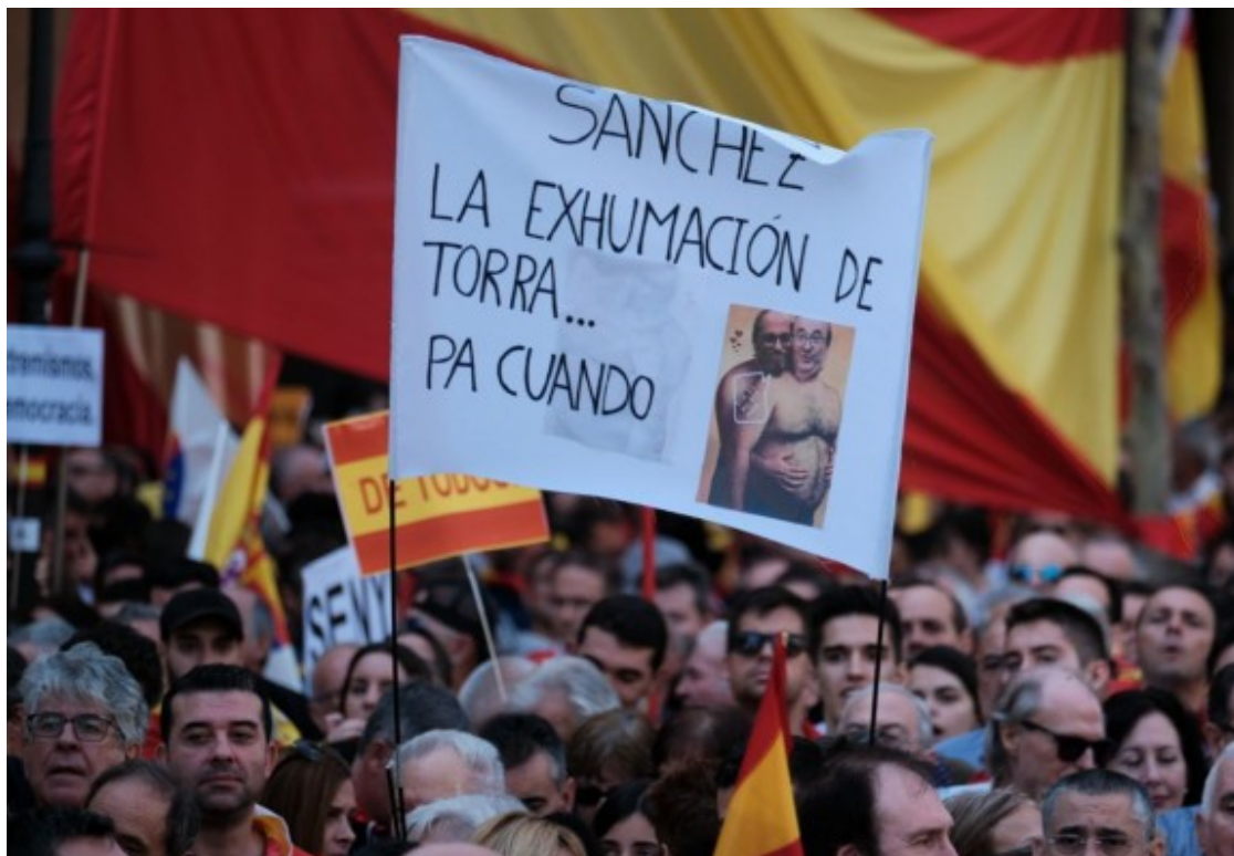
Un cartell demanant l'exhumació de Torra en una manifestació de Societat Civil Catalana.