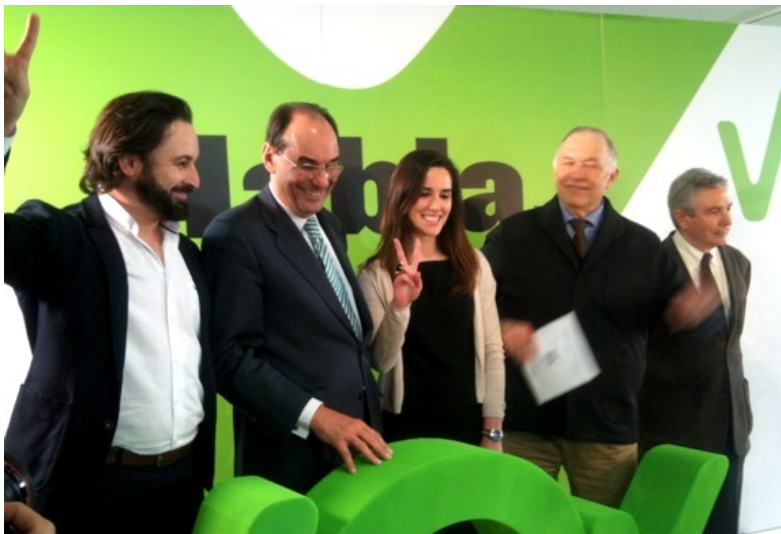
Santiago Abascal i Aleix Vidal-Quadras, el 2014 en un míting electoral de Vox.