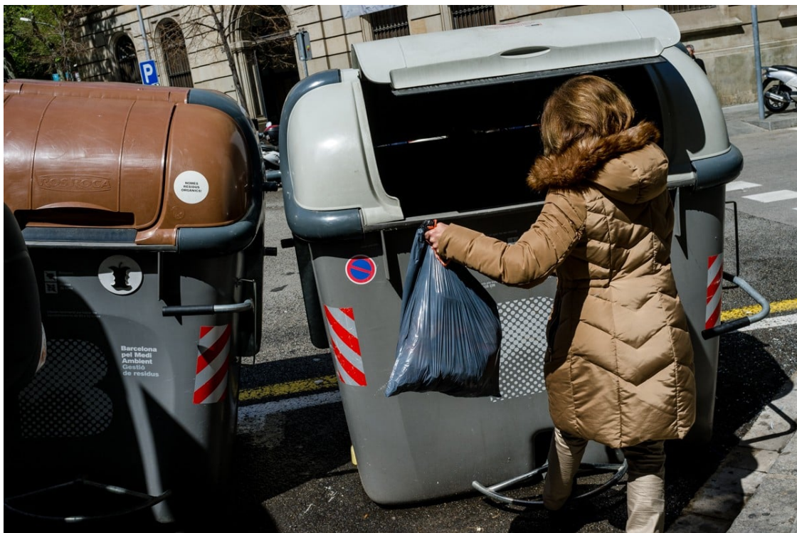
Una ciutadana llençant les escombraries al contenidor. | Adrià Costa

La motxilla de residus que la societat catalana ha de gestionar dia a dia és enorme | Diverses experiències demostren el potencial de circularitat que podrien tenir la majoria de residus que produïm