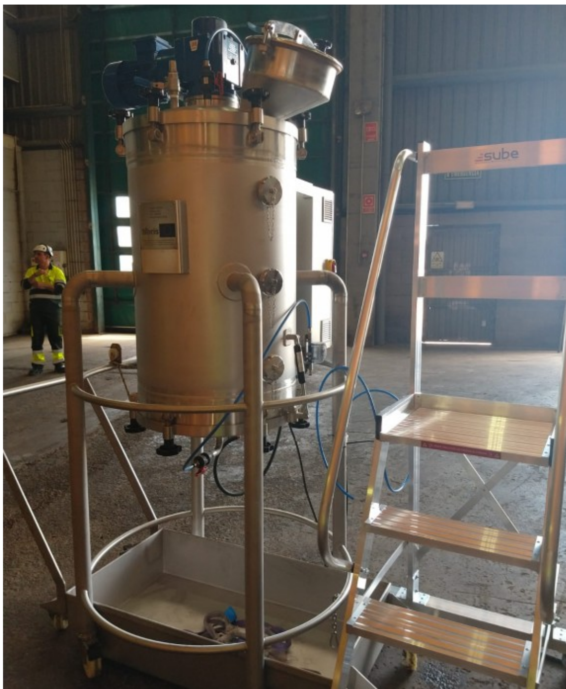
Reactor pilot de producció de biopesticides a partir de residus urbans.

Aquestes dues experiències, que estan en fase de desenvolupament tècnic, són molt importants ja que demostren el potencial de circularitat que podrien tenir la majoria de residus que produïm . Òbviament, suposen un canvi de paradigma, i requereixen canvis en les instal·lacions actuals, que sovint estan pensades linealment. Per exemple, en el cas dels biosurfactants cal combinar residus diferents: olis usats i residus de la indústria alimentària o, en el cas dels biopesticides, cal afegir microorganismes específics a residus com els municipals.