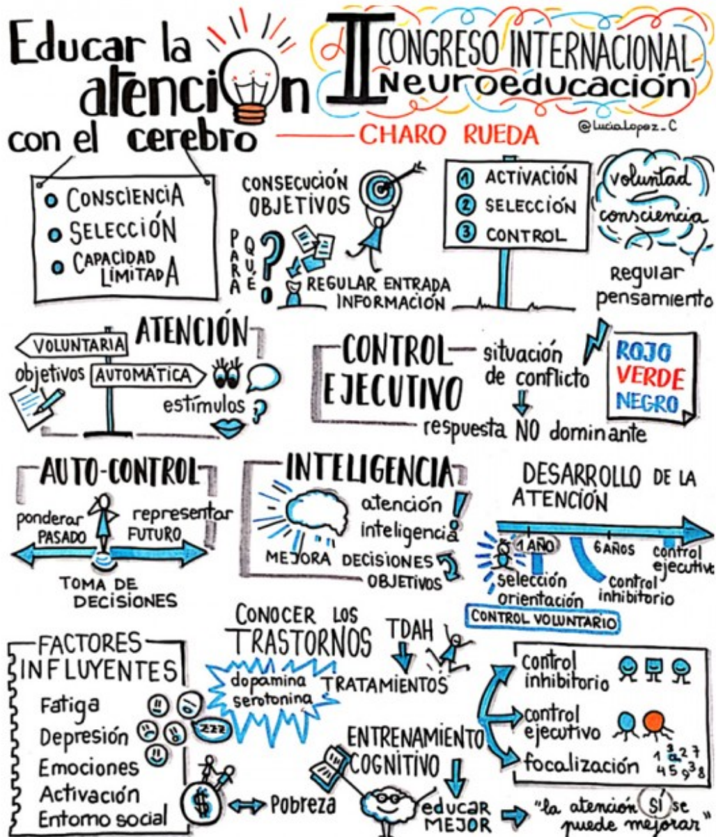
Educar l'atenció amb el cervell. II-il·lustració: Lucía López.